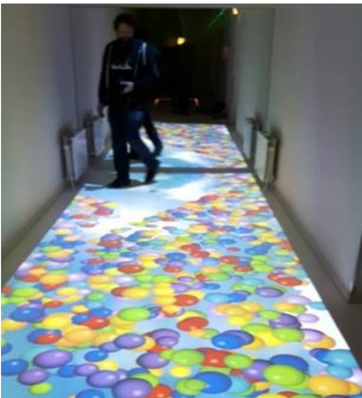
Living Surface, eine interaktive Flur

- „so normal wie möglich, nur speziell wenn nötig“ –