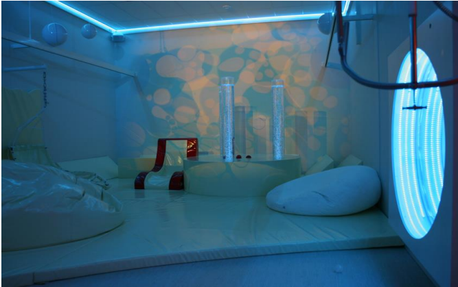
Die neuen Snoezelenraum ( 2017)

Die Praxiseinheiten dauern den Thementage finden statt in den 400 m 2 großen neuen Snoezelenzentrum des Hartenbergs.